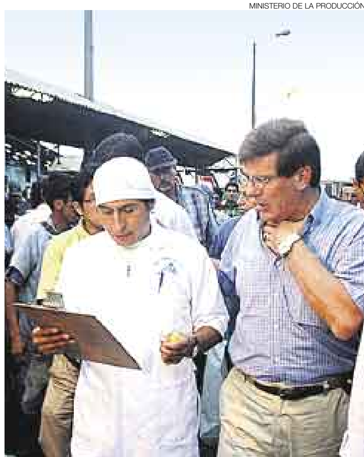
SUPERVISIÓN. Rafael Rey anunció que se evitará la especulación de los precios del pescado con la venta directa de jurel a un sol por cada kilo.

El Gobierno descarta que las alzas de los últimos días se deban a un hipo inflacionario; las vincula con especulación. En esa línea, el Ministerio de Agricultura reiteró que en las últimas semanas no hubo cambios bruscos en los precios de las verduras y hortalizas.