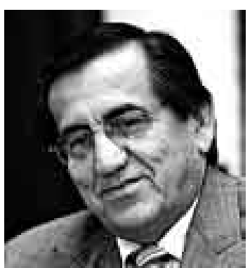
DEL CASTILLO. Exige seriedad.

trás de ese tema y lo han hecho de manera ilegal”, opinó.