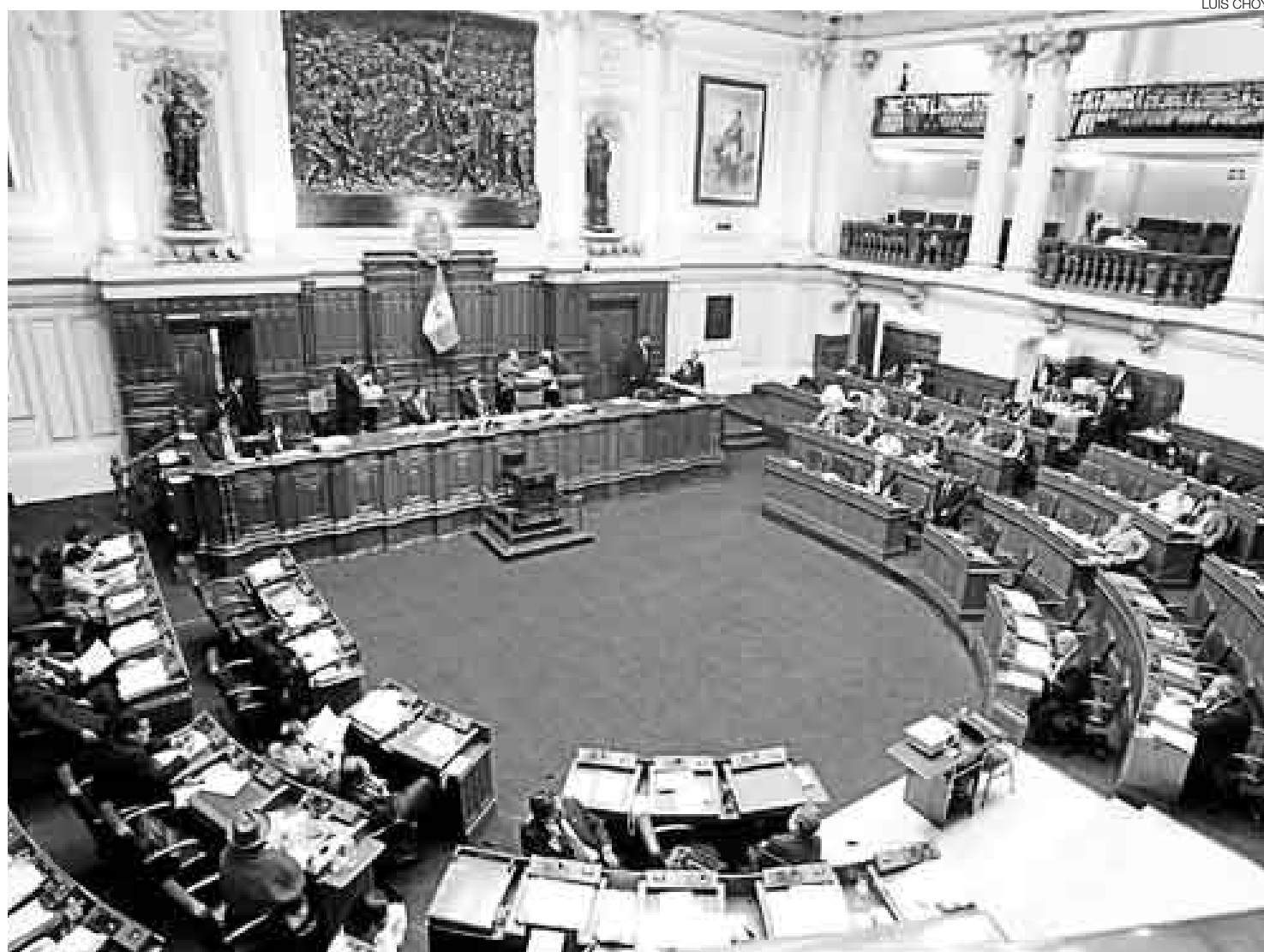
UN DAÑO MÁS SÍ IMPORTA. El Congreso aprobó la Ley Orgánica del Poder Ejecutivo en diciembre último, pero hoy un nuevo escándalo lo salpica.

Considerando el descanso por Semana Santa, recién a partir del próximo lunes la procuraduría denunciaría a los que resultasen responsables de los delitos señalados ante alguna de las fiscalías especializadas en lo penal.