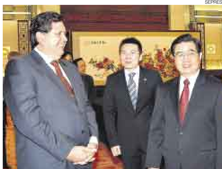
REUNIÓN CLAVE. El mandatario peruano dijo que el Perú defenderá a China en temas como su oposición a la independencia de Taiwán y el Tíbet.

Para facilitar la conexión entre nuestros países hemos hablado