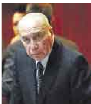
EX GOBERNANTE. Morales Bermúdez colaborará con la justicia.

Igualmente, el país requirente (en este caso Italia) debe comunicar la descripción del hecho delictivo con la indicación del tiempo y lugar en que fue cometido; la calificación del delito, así como la pena prevista o, en su caso, la pena por cumplir y los elementos necesarios para la identificación de la persona a la que se pide detener.