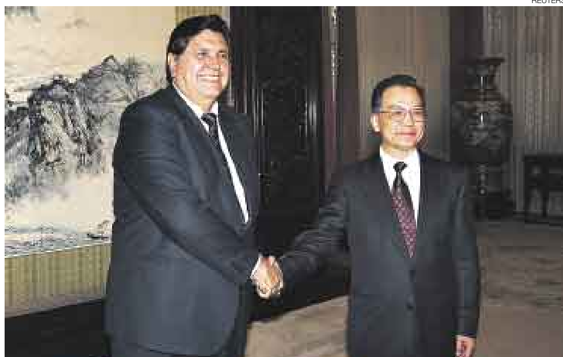
MÁS CERCA. Alan García se trasladó a Zhongnanhai, la histórica residencia de los líderes chinos, en donde se reunió con el primer ministro Wen Jiabao (en la foto). Luego acudió a una cena ofrecida por Li Changchun, otro alto dirigente.