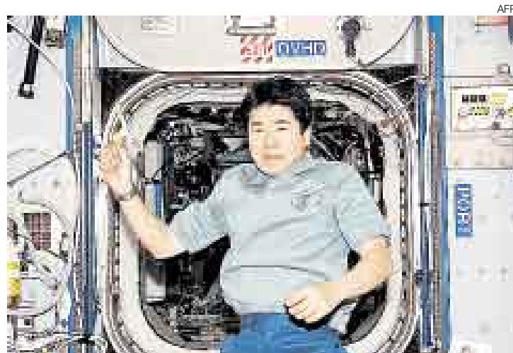
EXPERIMENTO. El astronauta Takao Doi lanza un búmeran en la Estación Espacial Internacional.

TOKIO [AFP]. Un astronauta japonés que se encuentra actualmente en la Estación Espacial Internacional (ISS) demostró que un búmeran lanzado en un medio de microgravedad vuelve al punto de partida, al igual que en la Tierra. El astronauta Takao Doi lanzó un búmeran de tres palas que regresó al lugar de partida, informó ayer la Agencia de Exploración Espacial Japonesa (JAXA).