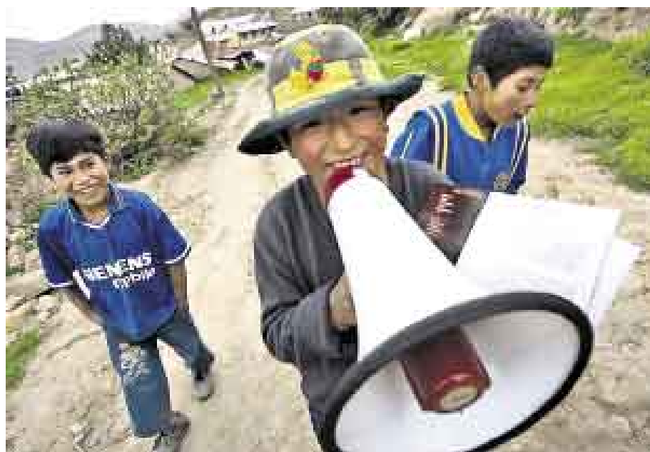
PUBLICIDAD. En Chilata, los mismos niños anuncian con un megáfono las películas de la tarde, en un descampado, a tres cuadras de la Plaza de Armas del pueblo.

La proyección es al aire libre y comienzan a llegar las mamás, los hombres con cascos mineros; son 200 espectadores en total. Cuando el sol se apaga, se enciende el proyector: primero se exhibe el dibujo