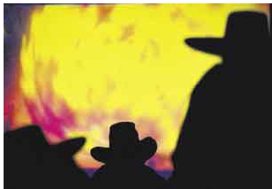
SOMBRA. Es como si fuera una puerta a otra dimensión, los niños se fascinaron al ver en el cine a dragones en animación. Después se exhibiría una película en clave de comedia.

El sueño de los 'nómadas' es comprar un écran inflable. ■