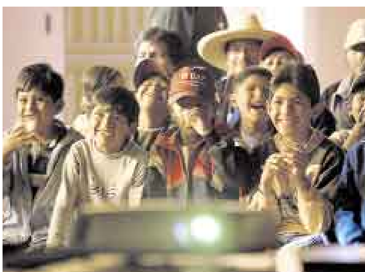
ALEGRÍA INFANTIL. En Yarabamba, los niños se reúnen en torno al proyector para ver "Dragones, destino de fuego".