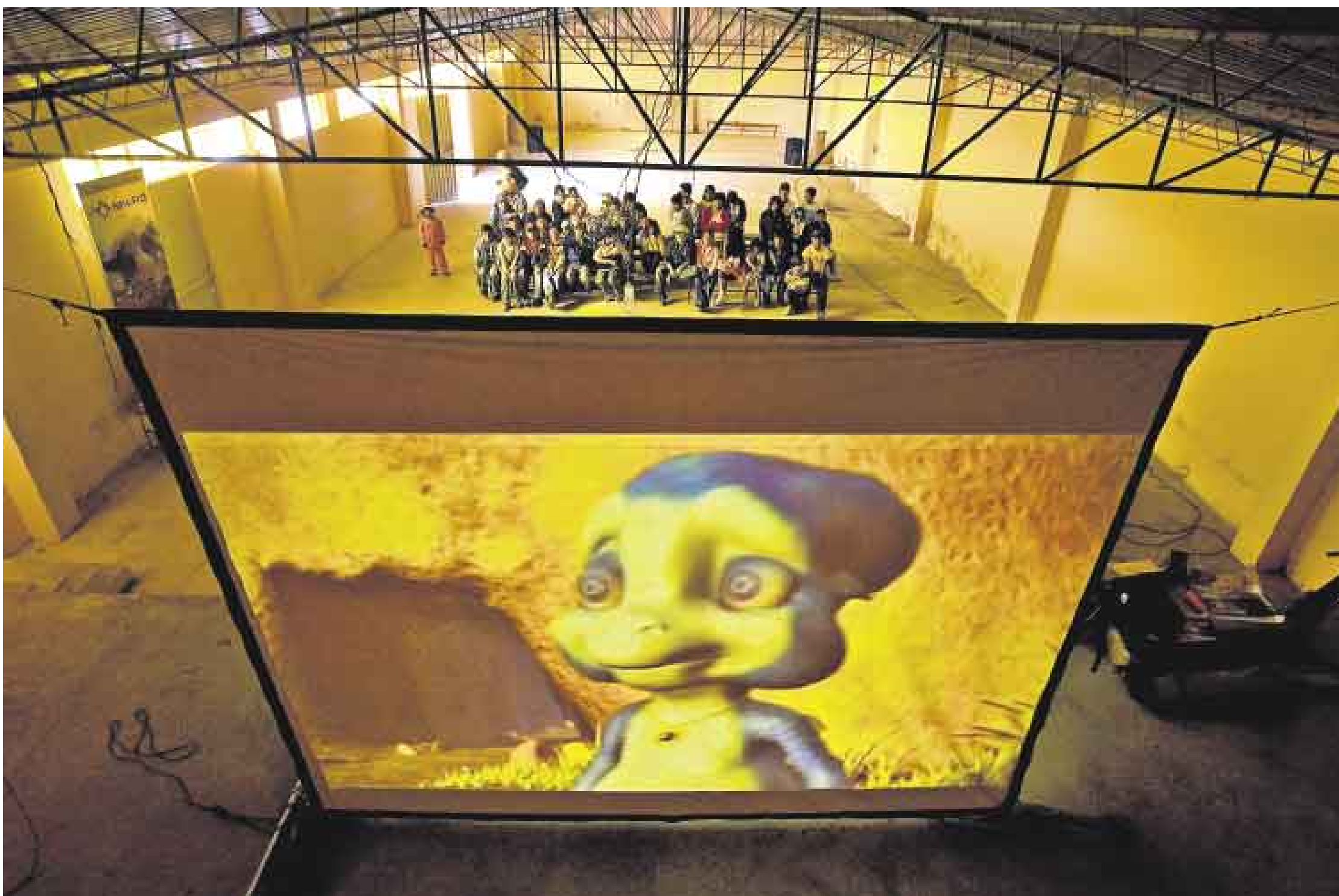
LA FUNCIÓN DE LOS NIÑOS. El éxito fue absoluto con los niños de Yarabamba, un pueblo minero que queda a una hora de la capital de Arequipa. Este proyecto empezó en julio del 2007, todo comenzó en Chanchamayo.