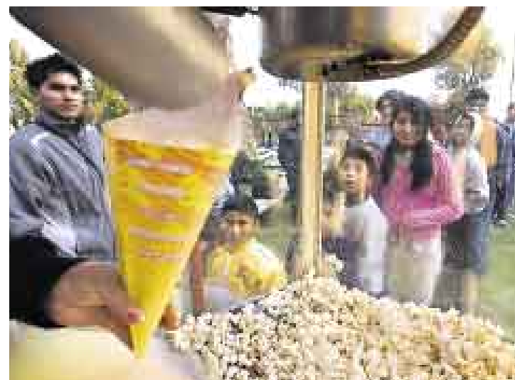
DE TODO. Es parte del paquete cinéfilo. Durante las proyecciones no suele faltar pop corn, como en la capital de Arequipa y en Uchumayo.