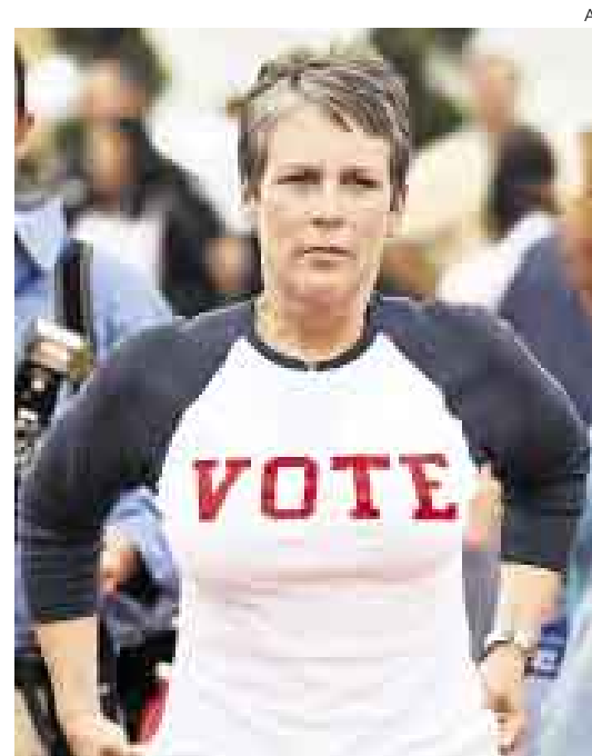
DESATADA. Jamie Lee Curtis muestra algo de piel.