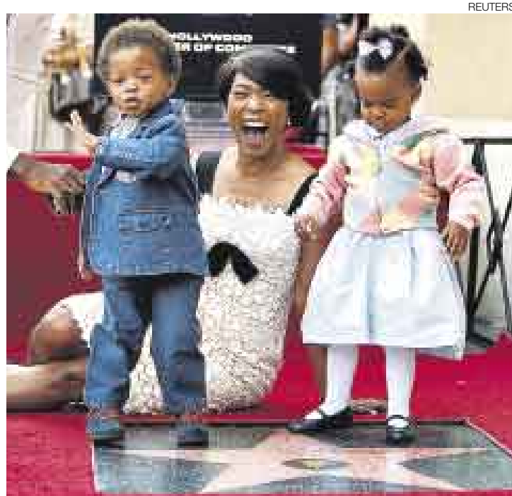
CELEBRA. Angela Bassett junto con sus dos hijos, Slater y Bronwyn.

Fishburne, que estelarizó con Bassett "What's Love Got to Do With It" en 1993, destacó la versatilidad de Bassett en el mundo del cine, donde filmó "How Stella Got Her Groove Back" en 1998.