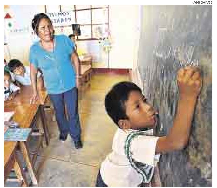
MÁS PRESUPUESTO. “Si se hace lo mismo que hasta ahora, se va a obtener lo mismo”. Falta más inversión, según el especialista.

No solo hay que inventariar la catástrofe, sino también las pistas de salida de la catástrofe. Algunas de esas pistas exigen decisiones mayores. Por ejemplo, invertir más, lo que implica afectar la presión tributaria, salvo que se piense en quitarle a otro sector. Eso es algo que tenemos que entender todos. Por otro lado, los incrementos no pueden ir a los profesores que tenemos ahora y que no saben leer. Hay que ponernos de acuerdo: a mejores capacidades y mejor desempeño, más remuneración.