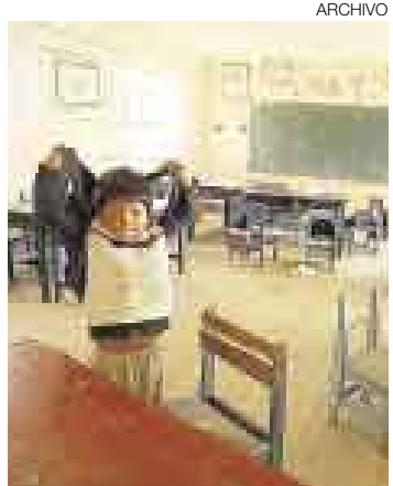
REALIDAD. En la última evaluación solo 151 docentes sacaron 14 o más.