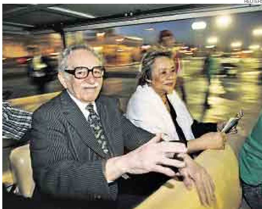
50 AÑOS. Gabriel García Márquez junto a su esposa Mercedes Barcha.

Allí, antes de salir con destino al altar, se enteró, por las notas de la columna De Sociedad, de "El Heraldo", que él ya había contraído nupcias "con distinguida da-