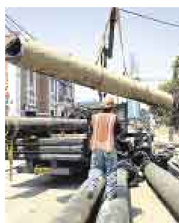
INICIATIVA. BID apoyará proyectos de agua potable y alcantarillado.

El Banco Interamericano de Desarrollo (BID) otorgará al Perú más de US$350 millones para ejecutar proyectos de mejora de servicios de saneamiento y recursos hídricos, informó Federico Basañes, jefe de la División de Agua y Saneamiento del banco. Los programas se realizarán en zonas periféricas de Lima y otras ciudades durante los próximos cinco años y beneficiará a más de 100.000 familias.