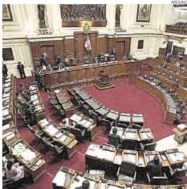
¿HABRÁ CONSENSO? Mientras Unidad Nacional tomará recién una decisión mañana, UPP podría apoyar la nueva propuesta sobre la ley.

■ Norma también se aplica para casos de lavado de activos, terrorismo y otros