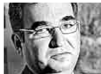
JORGE BRAVO ROSELLÓ ABOGADOS

“El problema es verificar que se ha pagado”