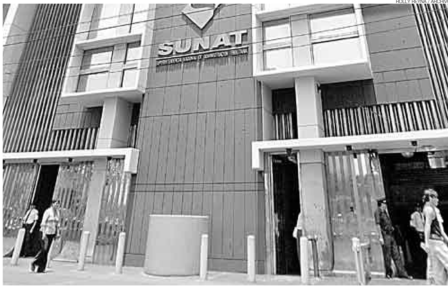
CUESTIONADA. La Sunat examinará el proyecto de ley que retira de sus facultades el cobro del RUS y el RER. La ira del Ejecutivo pende sobre ella.

“Hasta el momento esto es un globo de ensayo, que ha distraído a la opinión pública del debate so-