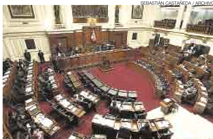
¿QUÉ PASA AQUÍ? Denuncian más cambios subrepticios en las leyes.

“De la revisión de los documentos, hay indicios de que el