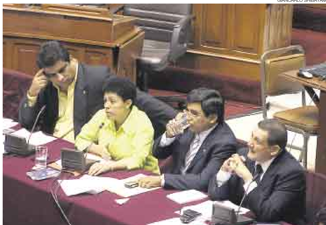
NO PUDIERON. La bancada fujimoista intentó defender a Pando en la Comisión Permanente.

Y aunque reconoció su falta, el fujimorista dijo no haberse beneficiado económicamente por este hecho. “Perder mi condición de congresista de la República sería un exceso”, declaró Pando ante la Comisión Permanente.