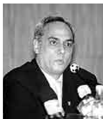
NO ES. Ante Registros Públicos, Burga no es el titular de la FPF.

Es la segunda vez que la FPF pretende inscribir la modificación de estatutos y por segunda vez que la Sunarp rechaza el pedido. Esto implica, entre otras cosas, que todos los actos del directorio actual