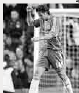
CRÍTICAS. Pizarro sigue de malas en Inglaterra.

Londres. El delantero peruano Claudio Pizarro fue considerado uno de los jugadores con peor desempeño de la Liga Premier, según señala la página web inglesa whoateallthepies.tv. El atacante del Chelsea, que apenas pudo marcar dos goles en 21 encuentros disputados, quedó en el quinto lugar de una clasificación que lidera su compañero, el ucraniano Andriy Shevchenko.