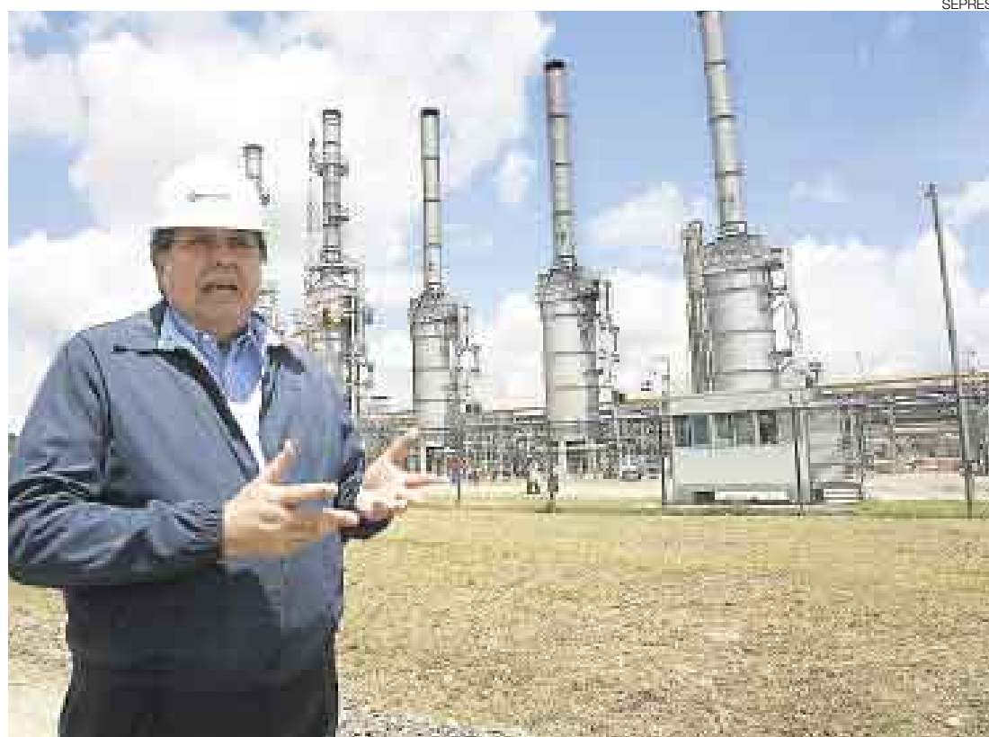
GAS ASEGURADO. El presidente Alan García visitó la planta de fraccionamiento de gas Las Malvinas.

Cabe recordar que las exportaciones del Perú a China, país