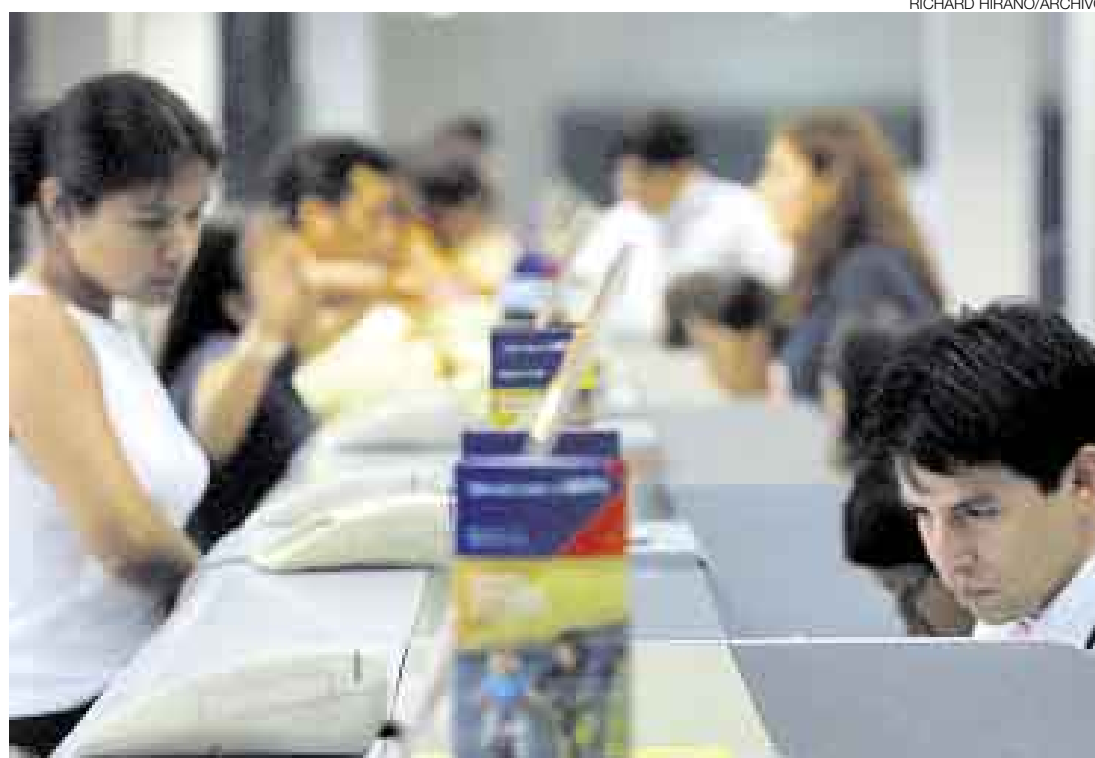
AUMENTO. El ritmo de incremento de los créditos de consumo preocupa a las autoridades, ya que con ello viene una mayor demanda y, por consiguiente, una presión inflacionaria.

Durante las últimas semanas se ha venido discutiendo entre el Ministerio de Economía, la SBS y