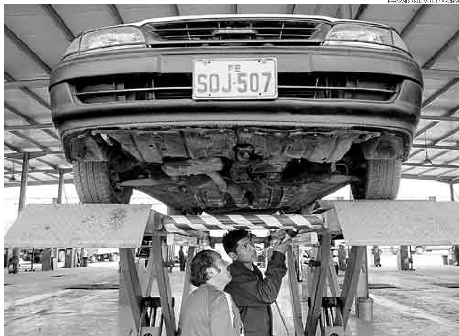
POR TODO LO ALTO. Las revisiones técnicas volverán a ser una obligación, solo que esta vez no solo en Lima, sino en todo el país y a cargo del MTC.

Salvo el congresista Yonhy Lescano (AP), quien manifestó estar en contra del dictamen –sostuvo que solo se buscaba sacarles más dinero a los ciudadanos, pues las pistas del país carecen de señalización y el MTC ha fracasado en la implementación del plan Tolerancia Cero–, los otros 15 legisladores que hicieron uso de la palabra defendieron la importancia del proyecto porque arguyeron que contribuirá a reducir los accidentes de tránsito y los problemas de contaminación ambiental causados por el mal estado de los vehículos.