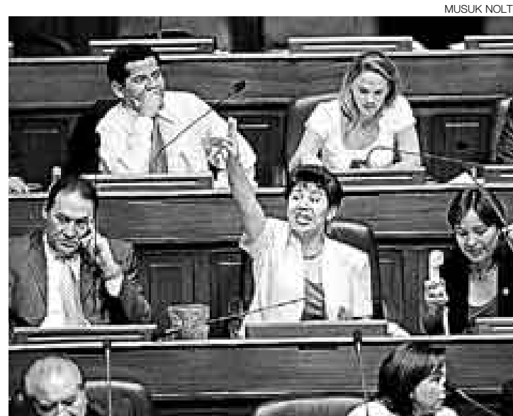
GRAN DEUDA. En el debate legislativo no se abordó la situación de quienes ya pagaron por pasar la revisión técnica y no recibieron el servicio.