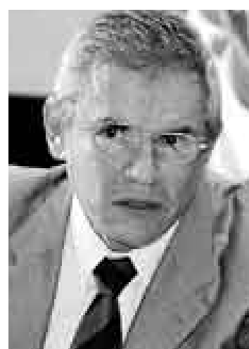
TRUNCO. El proyecto del alcalde Luis Castañeda no alzó vuelo.

La justificación municipal fue que la empresa no había cumplido con instalar una planta de revisiones en el Jockey Plaza, que debía haber estado funcionando en octubre del 2007, así como reiterados incumplimientos de otros puntos previstos en el contrato.