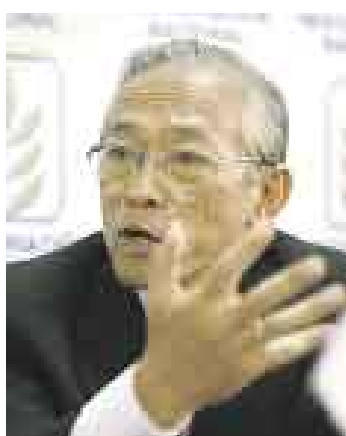
HUMBERTO LAY. Presidente del partido Restauración Nacional.

Para el líder de Restauración Nacional, Humberto Lay, la ley del divorcio rápido debería ir acompañada por la creación del ministerio de la familia, pues —en su opinión— la Constitución establece que el Estado debe proteger a la familia. Lay adelantó que su agrupación apoya la idea de transformar el Ministerio de la Mujer y Desarrollo Social por el ministerio de la familia y desarrollo social.