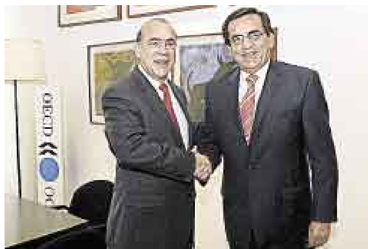
DE GIRA. Jorge del Castillo culminó su visita a España y Francia. En París fue recibido por Ángel Gurría, secretario general de la OCDE.

Indicó que ya se le ha dicho a Chávez que sus programas sociales “los puede hacer encima de la mesa, pero no por debajo de la mesa”. También recordó que si bien