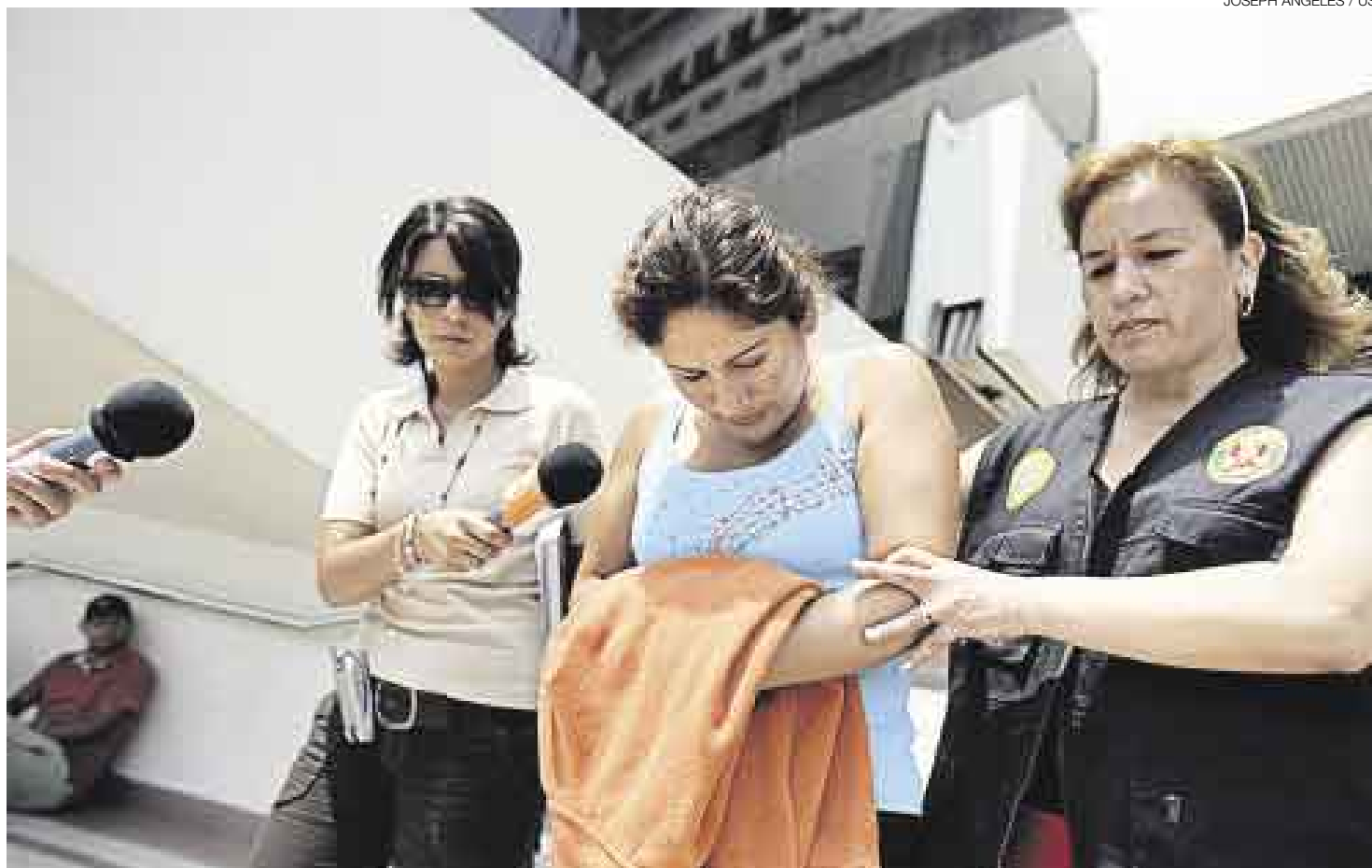
NO PUDO VIAJAR. Los detenidos son acusados de los delitos de tráfico de migrantes y falsedad genérica. Ayer fueron trasladados al Ministerio Público.

Según el alto oficial, la mujer ha confesado su delito y por ello se sabe que cobró US$7.500 por persona, que operaba desde el