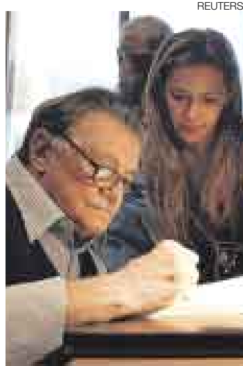
LA TREGUA. Aunque sigue hospitalizado, escritor se recupera.

MONTEVIDEO [REUTERS]. El escritor uruguayo Mario Benedetti, de 87 años, permanecía hospitalizado el viernes luego de ser internado la noche anterior por un cuadro febril que superó en pocas horas, dijo un allegado al autor.