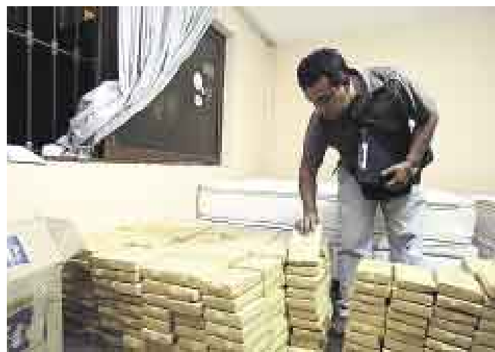
DECOMISADOS. Los agentes de la Dirandro contaron con mucho cuidado los 'ladrillos' de droga encontrados en viviendas del Callao y La Molina.

■ 15 DE MARZO. En el aeropuerto Jorge Chávez se hallaron 33 kilogramos de clorhidrato de cocaína camuflados en un lote de mantas que iba a ser embarcado a España. Se detuvieron a cinco sujetos que trabajaban en el aeropuerto.