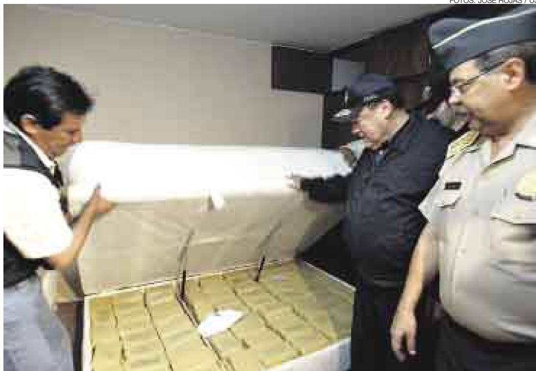
ALLÍ ESTÁN. Camuflados dentro de colchones de doble fondo se encontraron cientos de paquetes de clorhidrato de cocaína. El ministro del Interior, Luis Alva Castro, y el director de la PNP, Octavio Salazar, encabezaron la operación.

Las operaciones estuvieron encabezadas por el ministro del Inte-