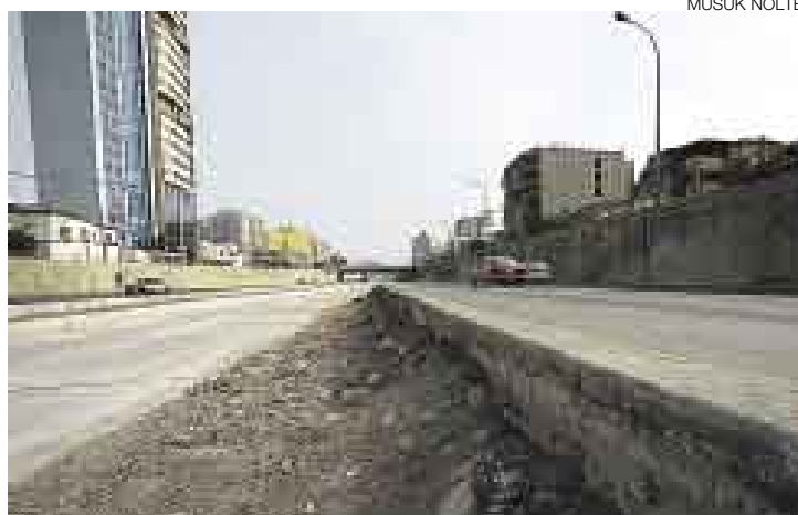
RIESGO. Los vehículos particulares podrían ser impactados por los buses que circularán por el centro de la pista, pues no se han instalado guardavías.

“Hasta el momento no hemos visto una disposición por parte del concejo de instalar mallas metálicas o guardavías, sobre todo en las zonas donde existen desniveles en-