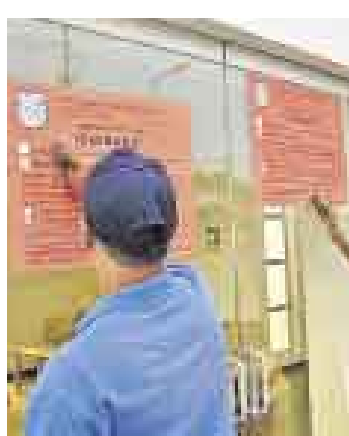
CLAUSURA. Surco detuvo obras del edificio Alto El Golf Los Incas.

La Municipalidad de Surco detuvo la construcción de un edificio denominado Alto El Golf Los Incas, a cargo de la empresa Consorcio Golf Los Incas, en la avenida Cerros de Camacho. La obra, que tiene proyectados ocho pisos con dos departamentos por piso, no cuenta con licencia de construcción y en el lugar se detonaba dinamita sin permiso de la Dicsamec, según el Concejo de Surco.