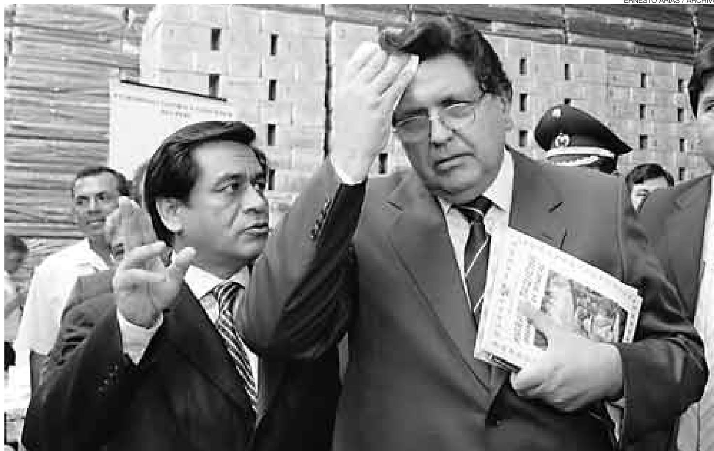
AJUSTE DE CLAVIJAS. A semejanza del guitarrista que afina sus cuerdas, el presidente García y el ministro Chang anunciaron nuevos cambios en Educación.

"Actualmente, existen 200 mil maestros sin trabajo, unos 78 mil formándose en instituciones educativas, y alrededor de 100 mil más en las facultades de educación de las universidades y programas a distancia", informó el ministro. Descartó que esta medida constituyera una violación a la autonomía universitaria.