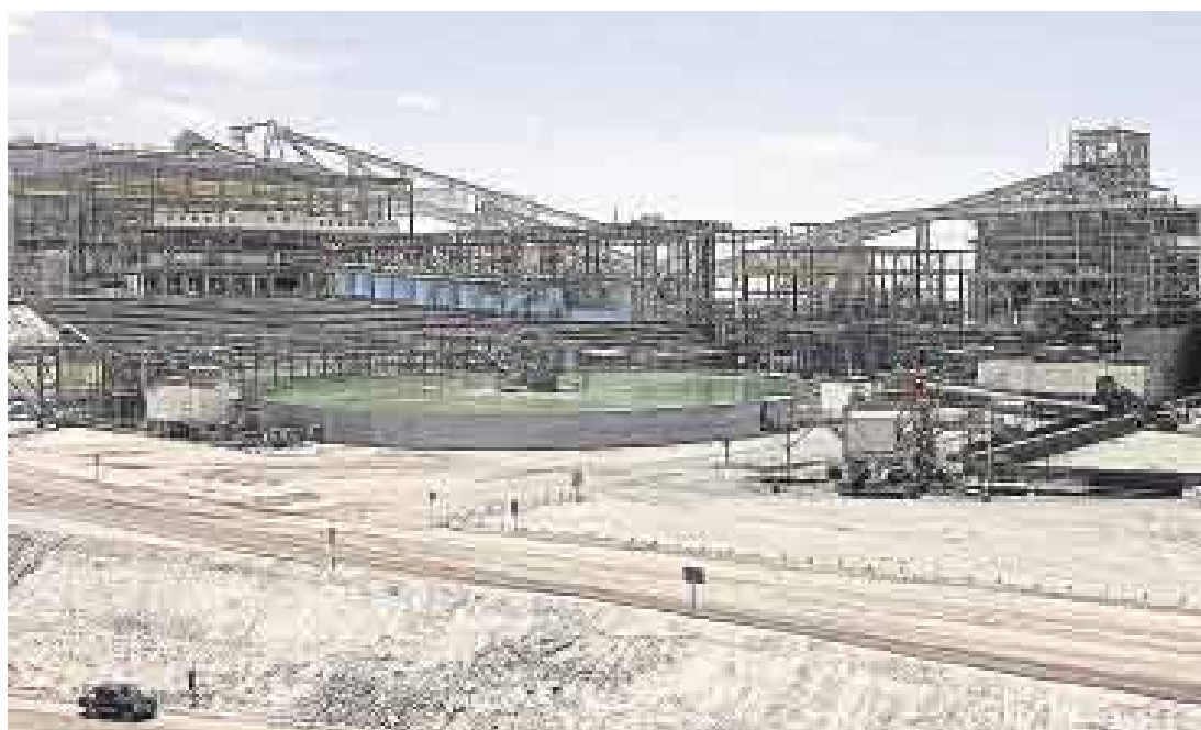
EN SUSPENSO. La brasileña Votorantim sabrá si obtuvo control de Milpo recién el 23 de abril.

Mientras esto sucede, en el mercado bursátil se han empezado a levantar una serie de especulaciones respecto de cuál será el desenlace de la OPA lanzada por Votorantim. La principal pregunta es si el precio propuesto por la acción de Milpo es el adecuado. La oferta de la brasileña es de alrededor de S/.8 por acción, pero ayer las acciones que se transaron a través de la Bolsa de Valores ce-