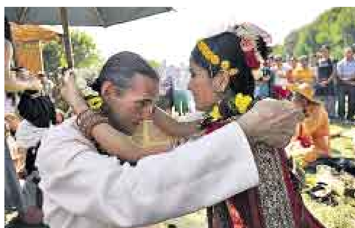
MATRIMONIO. En una ceremonia de fuego, donde atan sus ropas.

de barro más alta del mundo, con luces naturales que ingresan por botellas incrustadas en los adobes.