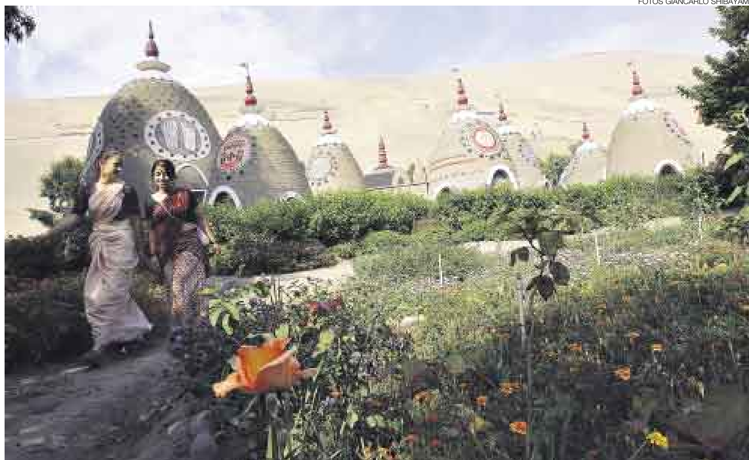
BUCÓLICO. Frente a las casas hay un truly dedicado a todas las religiones, que se inaugurará con el gran Mela, este 21 de mayo: www.ecotrulypark.org .

Todavía quedan restos de los primeros trulys fallidos que sufrieron rajaduras hasta llegar a los actuales de 4 metros de diámetro por 5 de altura y al truly maestro que tiene 8 metros de diámetro, 12 de alto y que, según Dwarka das, uno de sus constructores, es la cúpula