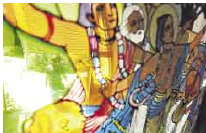
VITRALES. El costo promedio de un truly es de 300 a 500 dólares.

La primera impresión de ser una gigantesca estación espacial se corrobora en la importancia que le dan los krishnas a la astrología. El llamado Gran Planetario Védico es un complejo en el centro del Eco Truly que combina 20 trulys de acuerdo con las concepciones estelares de los Vedas: desde la salida del mundo material que se inicia en la plazoleta de la humildad hasta llegar al gran altar, a donde se llegaría al universo anti-material, con el piso de mármol y una semicúpula con cañas, ichu y madera. Hay seis