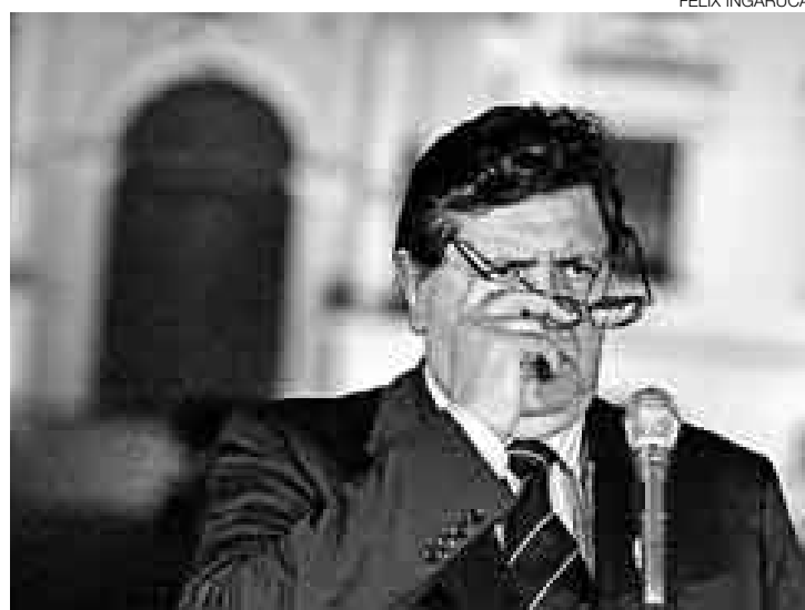
ACUERDOS PARA LEER. Terminada la reunión, el presidente García salió al patio de honor para dar a conocer los acuerdos adoptados.