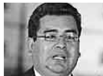
CÉSAR ÁLVAREZ PRESIDENTE REGIONAL DE ÁNCASH

Creo que esta reunión ha sido muy fructífera y le digo al pueblo ancashino y al pueblo de Chimbote: acá está la resolución suprema que el presidente de la República me ha entregado el día de hoy (ayer), en la cual nos devuelve el puerto de Chimbote