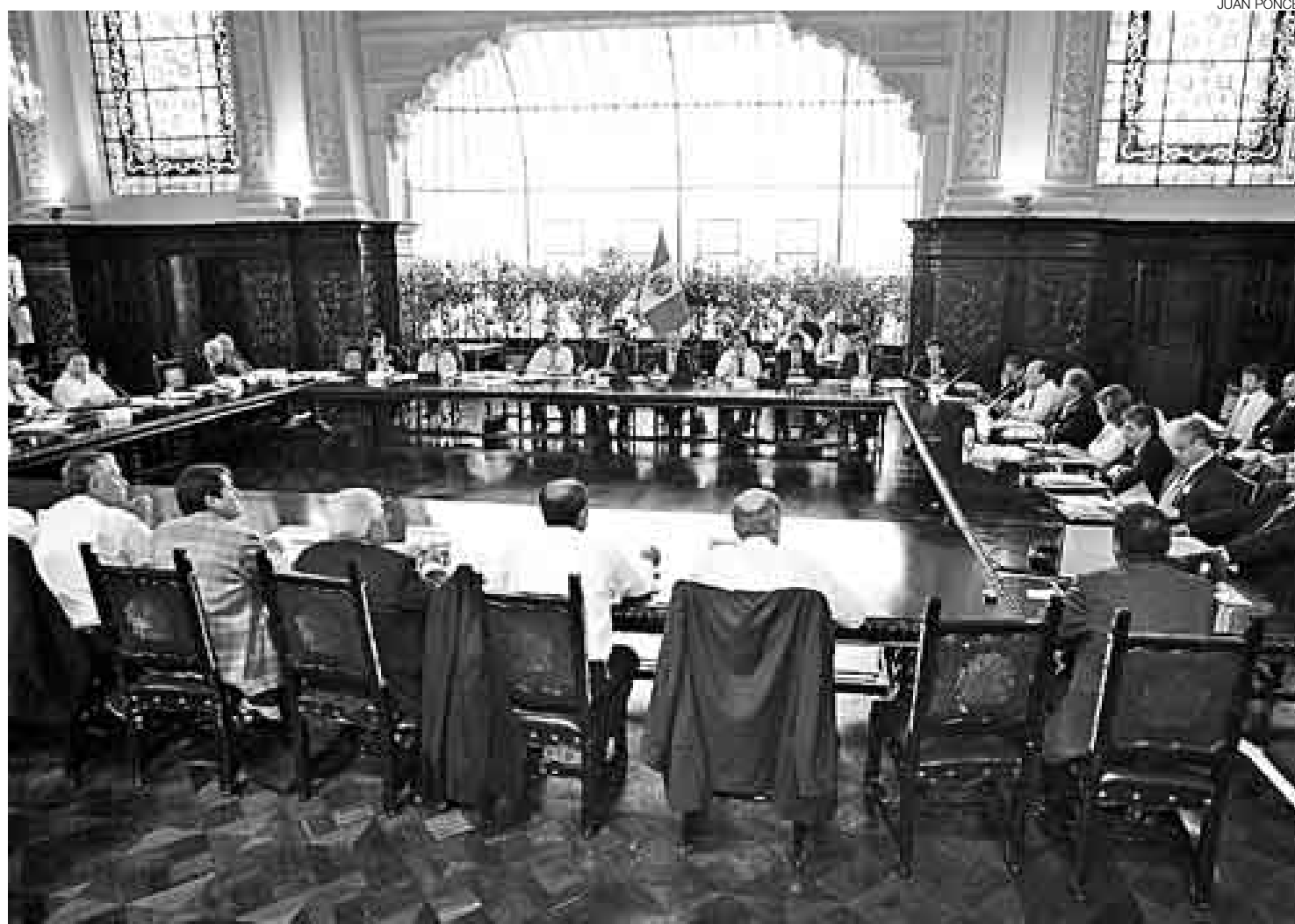
TRABAJO DURO. El foro de coordinación se llevó a cabo en el gran comedor de Palacio de Gobierno. Se prolongó por horas y no hubo almuerzo.

De este modo, los departamentos que actualmente recaudan mayores recursos gracias al canon minero compartirían sus