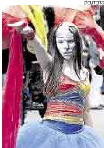
EJEMPLO. El Festival Iberoamericano de Teatro es una muestra del apoyo estatal a la cultura en Colombia.

BOGOTÁ [EFE]. El Gobierno Colombiano apoyará con 2,4 millones de dólares las creaciones artísticas, culturales y de investigación en distintas áreas, informaron ayer fuentes oficiales. El Ministerio de Cultura anunció la creación de un portafolio con 47 convocatorias para entregar becas, premios, pasantías y residencias, y para ello cuenta con la cooperación de instituciones nacionales e internacionales.