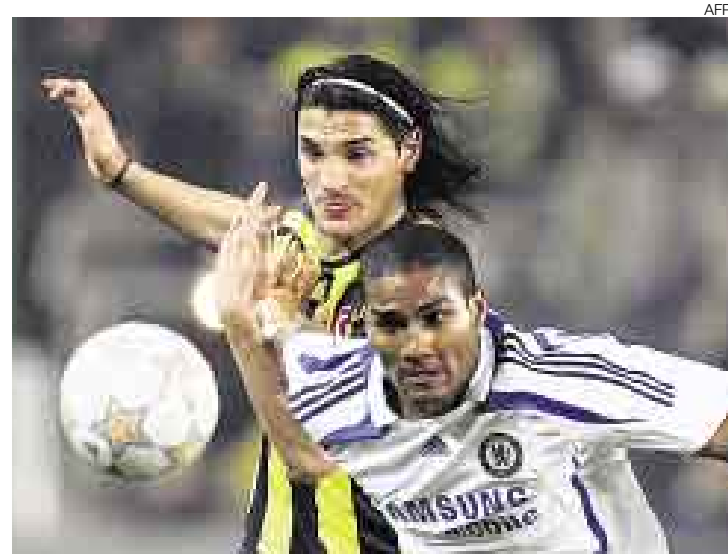
INTENSO. El Fenerbahçe impulsó su condición de local.

El técnico israelí del Chelsea, Avram Grant, dispuso a sus jugadores de una manera menos habitual a la que tiene acostum-