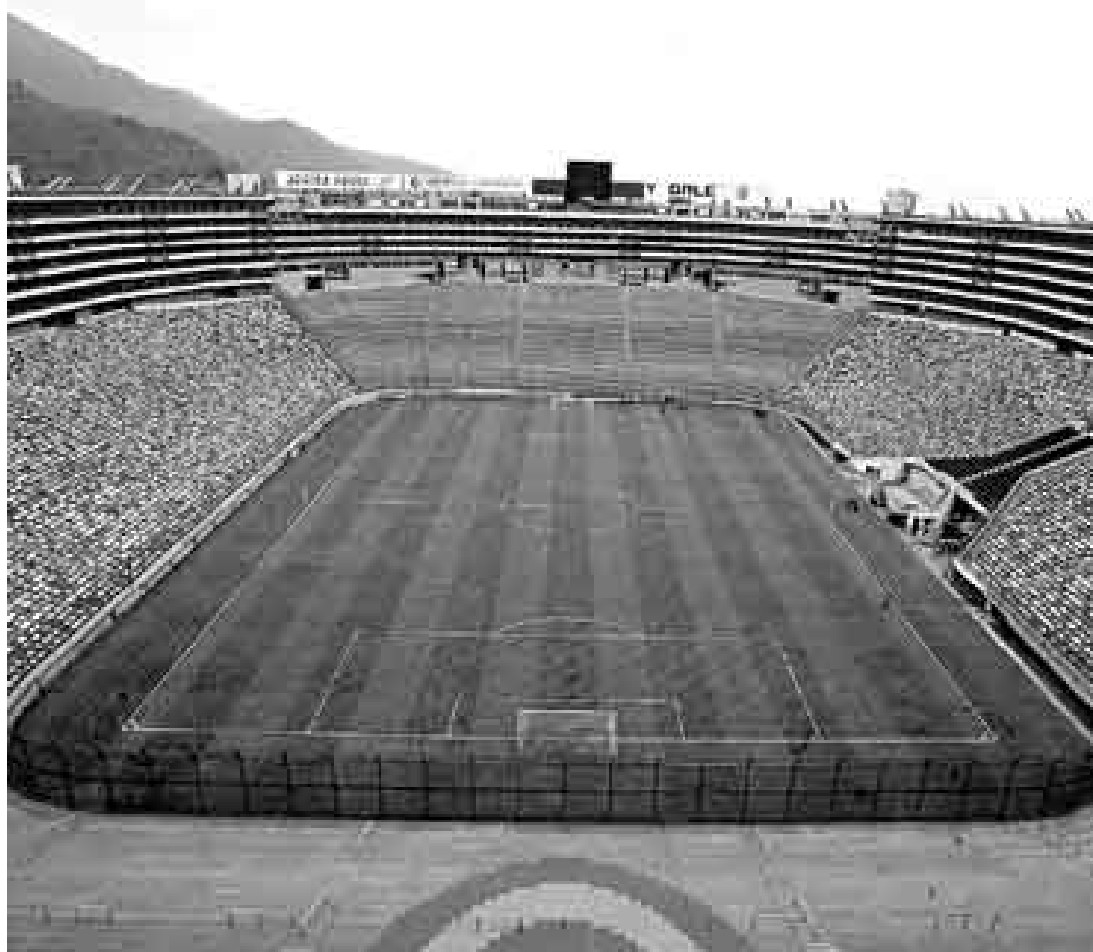
¿CUÁNDO SERÁ? Desde hace seis años Universitario no puede jugar un clásico con Alianza Lima en Ate.

C. La Dirección General de Gobierno Interior emite una resolución que da luz verde para el partido y le exige a la policía poner en práctica las garantías de segu-