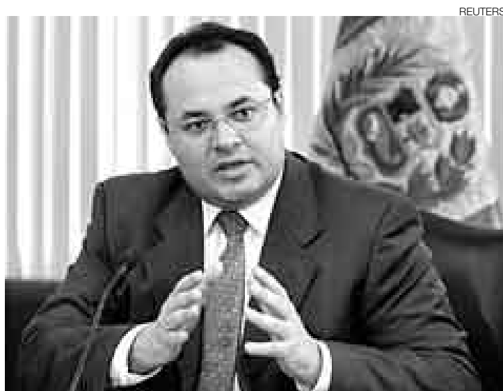
OPTIMISTA. El ministro Luis Carranza está muy confiado en el destino positivo del Perú para los próximos años.

tros ahorros valen más y eso significa que en los próximos meses la inversión en nuestro país va a crecer significativamente lo que se traducirá en más empleo y facilitará una importante reducción de la pobreza, que