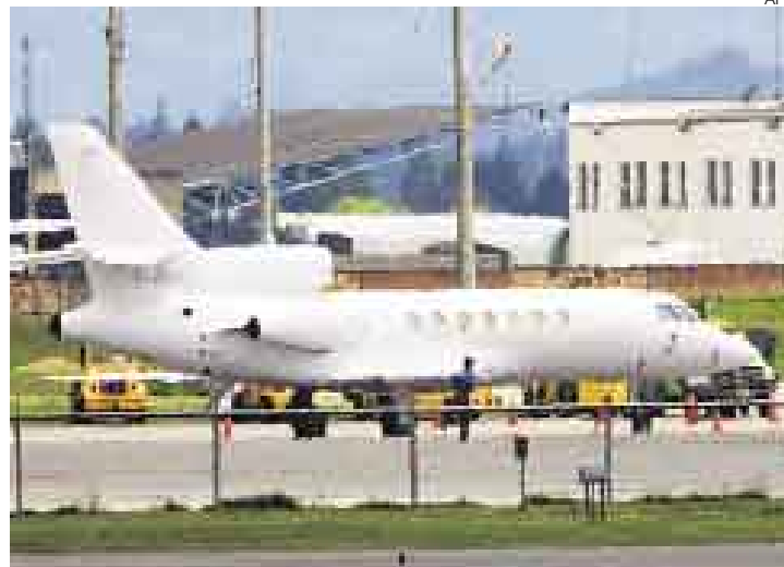
EN ESPERA. El avión dispuesto por el Gobierno Francés para brindar atención médica a los rehenes de las FARC sigue esperando en Bogotá.