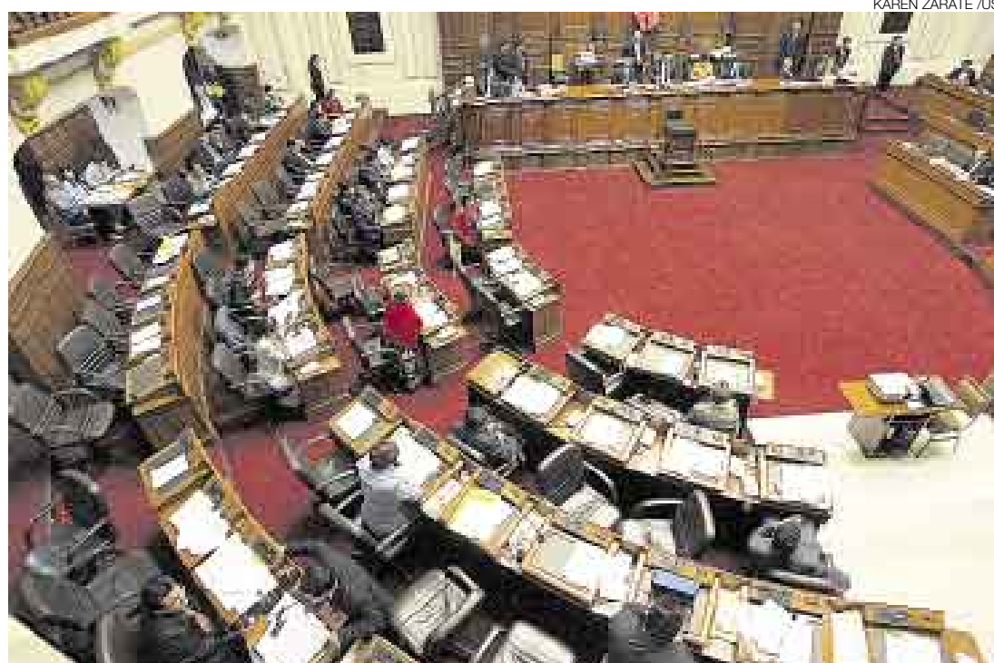
EN CAPILLA. Para evitar que sea archivada se reconsiderará la votación de la ley de carrera judicial en el pleno.

De pronto y cuando el titular del Parlamento sometía a votación la norma –cuyo debate se remonta al 2006 y ha sido varias veces revisada y corregida para instaurar, por ejemplo, la evaluación a los jueces cada tres años y medio– muchos legisladores dejaron sus asientos para cumplir con un compromiso social en el local sanisidriño de la delegación diplomática de Japón.