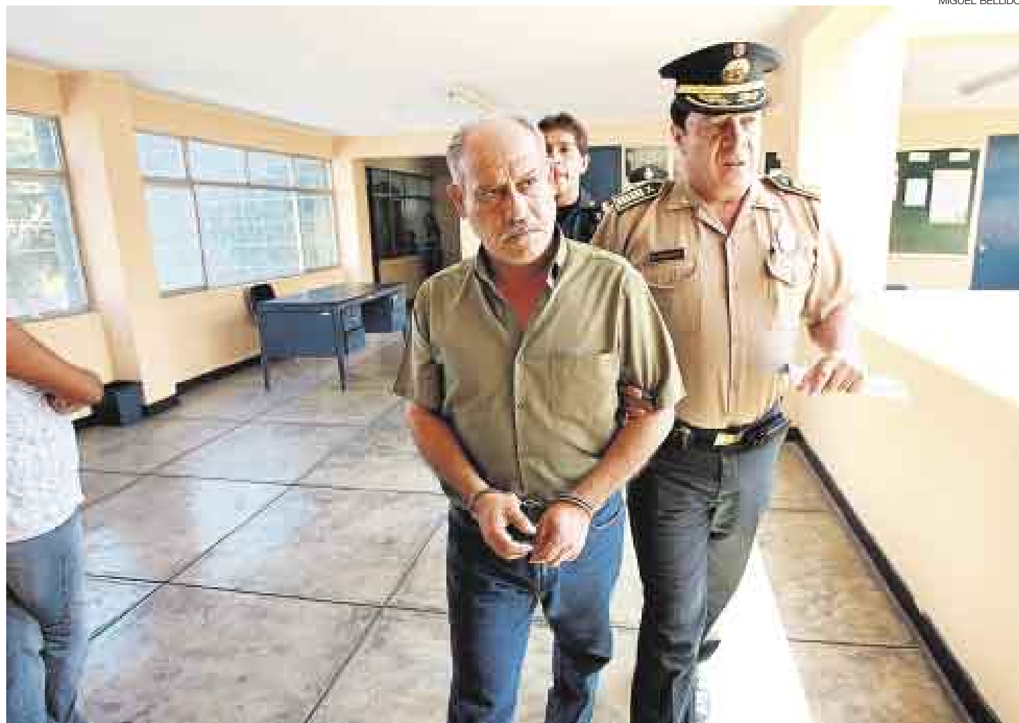
ATRAPADO. Quien fuera uno de los más despiadados integrantes del grupo Colina aparece esposado y derrotado en la comisaría de Barranco.