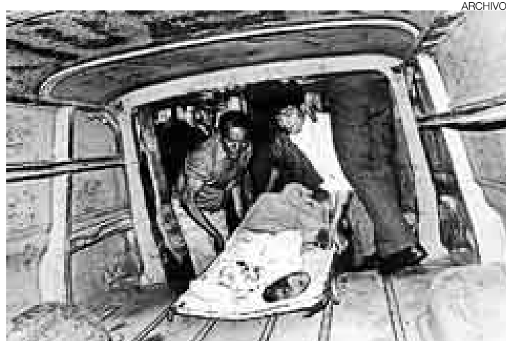
RESPONSABILIDADES. La matanza de Barrios Altos, uno de los sangrientos hechos por los que debe responder el grupo Colina.

En ese proceso también fue incluido por la desaparición de nueve campesinos del Santa, en Chimbote, ocurrida el 2 de mayo de 1992. Este hecho atribuido al grupo Colina se habría producido, según confesaron algunos miembros de ese destacamento militar, como un 'favor especial' para un empresario algodónero de Chimbote, allegado al enton-