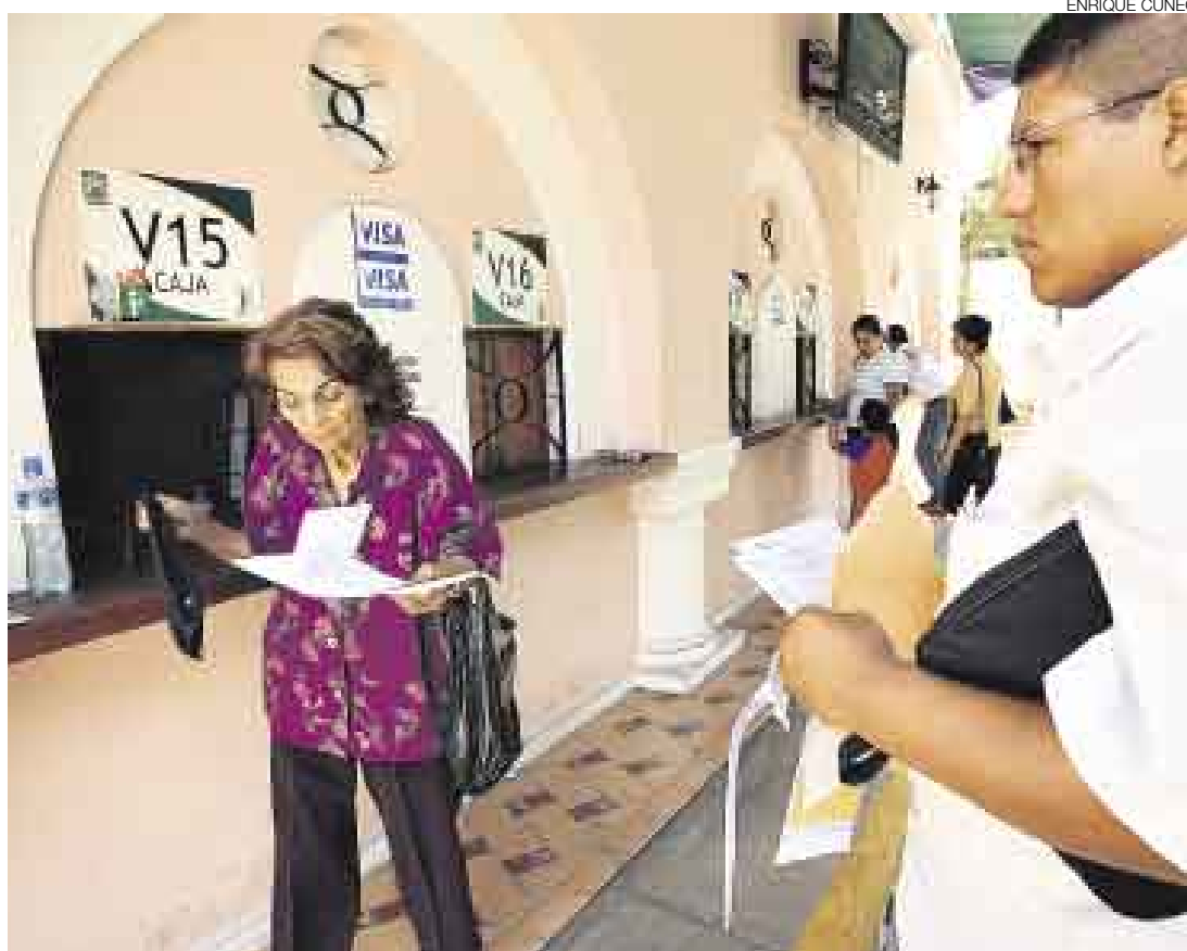
DESCUENTOS. Hay 11.000 contribuyentes que forman parte del programa Jesús María Puntual.

La medida se adoptó ante la baja tasa de cumplimiento en el pago de los tributos municipales, a pesar de las facilidades que la Gerencia de Rentas de Breña da a los contribuyentes. El descuento fue de 15% a 20% por el pago del mon-