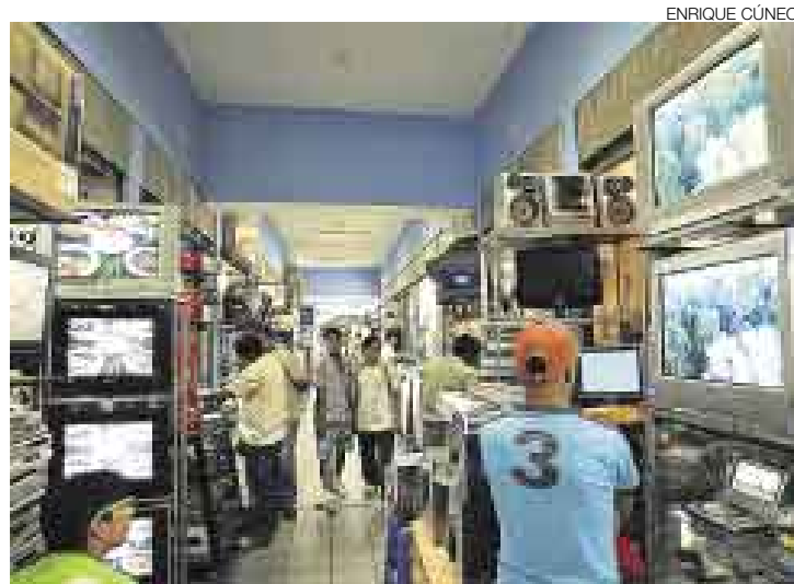
SOLO HORAS. Por la tarde, algunos comerciantes—en especial los que venden DVD y CD piratas—ya se habían abastecido de mercadería.

una lluvia de piedras y bombas incendiarias lanzadas desde ese local. Para repeler el ataque, la policía lanzó granadas lacrimógenas y logró ingresar con dos tanquetas blindadas que derribaron dos puertas de metal. El gas lacrimó-