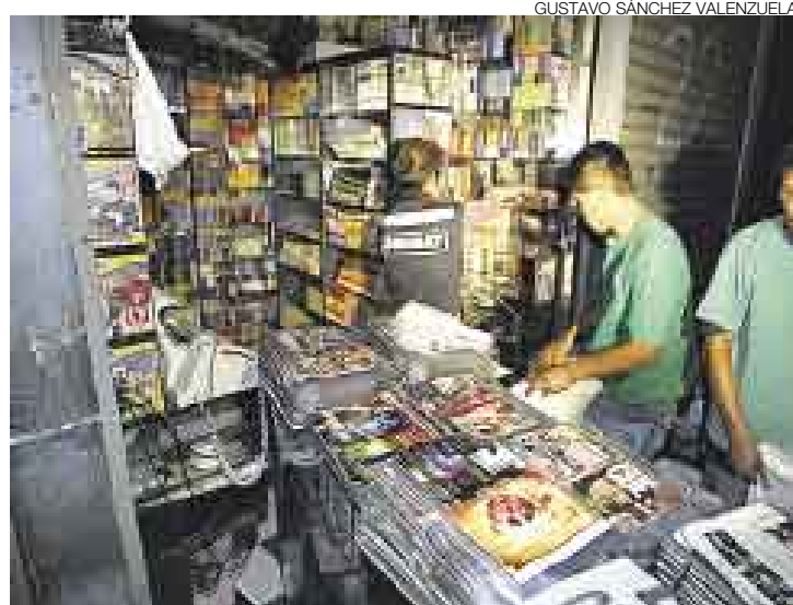
DECOMISO GENERAL. La policía incautó la mercadería pirata y de dudosa procedencia que encontró en 240 puestos de Polvos Azules.

La operación policial, en la que participaron más de 100 funcionarios del Ministerio Público, de la Sunat y del Ministerio de la Producción, se inició a las 2 a.m. Los primeros efectivos en llegar al centro comercial fueron recibidos con