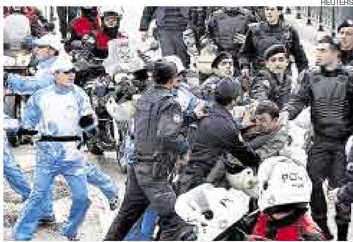
FURIA. En Turquía también hubo protestas y pidieron el boicot a China.

rechos humanos, sino si el movimiento olímpico respeta los derechos humanos", insistió. La organización Amnistía Internacional publicó un nuevo informe titulado "La cuenta regresiva olímpica: la represión de los activistas amenaza el balance de los Juegos Olímpicos". En este trabajo, la ONG considera que cada vez es menos probable que la situación de los derechos humanos mejore.