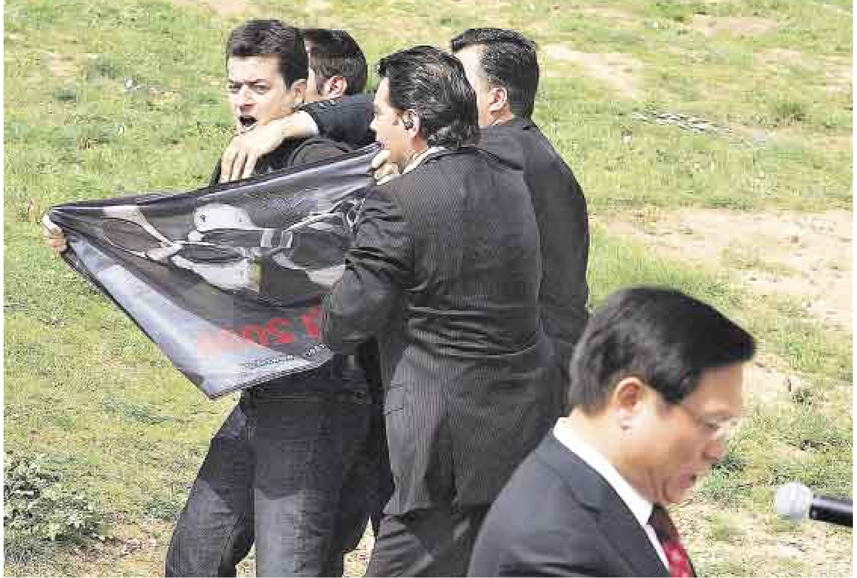
PROTESTA GENERAL Defensores de los derechos humanos irrumpieron en la ceremonia de encendido de antorcha en Grecia. Todo un símbolo de protesta contra China por el asunto del Tíbet.