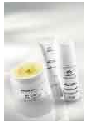
CHRONOS. BUSCAN CRECER EN SEGMENTO PARA MUJERES.

El mercado de cosméticos cerró el 2007 con US$945 millones. Natura, sexta en el mercado local, alcanzó el 6% de ese monto. En el 2008 llegarán a México, Colombia y Venezuela. ▲