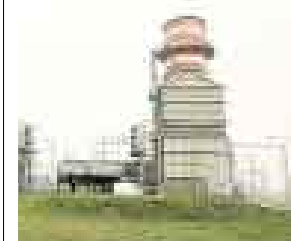
SE VIENE. PLANTA ELÉCTRICA OPERARÍA EN EL 2010.

La japonesa Mitsui Maquinarias presentó un pedido de iniciativa de inversión privada para construir una planta termoelectrónica, que a la vez desalinizará agua de mar; dicha planta se ubicaría en el distrito de Pucusana. La inversión sería de US$750 millones y la intención para desalinizar agua es abastecer a las viviendas que se encuentran en balnearios del sur de Lima.