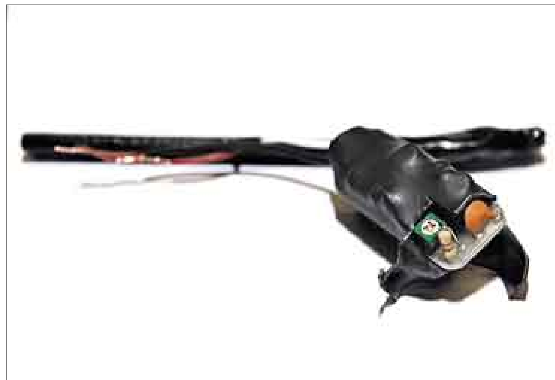
INTERCEPTACIÓN. Este es el aparato de interceptación telefónica descubierto y que procedería de Colombia

Del Castillo dijo a este Diario que no hay plazo alguno para concluir las investigaciones que se han dispuesto en los sectores de Interior y Defensa, así como de la Dirección Nacional de Inteligencia para el deslinde de responsabilidades. Empero, subrayó que resulta inadmisibles cualquier mecanismo de interceptación telefónica porque afecta los derechos de las personas.