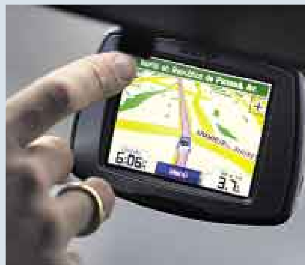
PRECISIÓN. EL MODELO STREET PILOT C550 EN ACCIÓN.