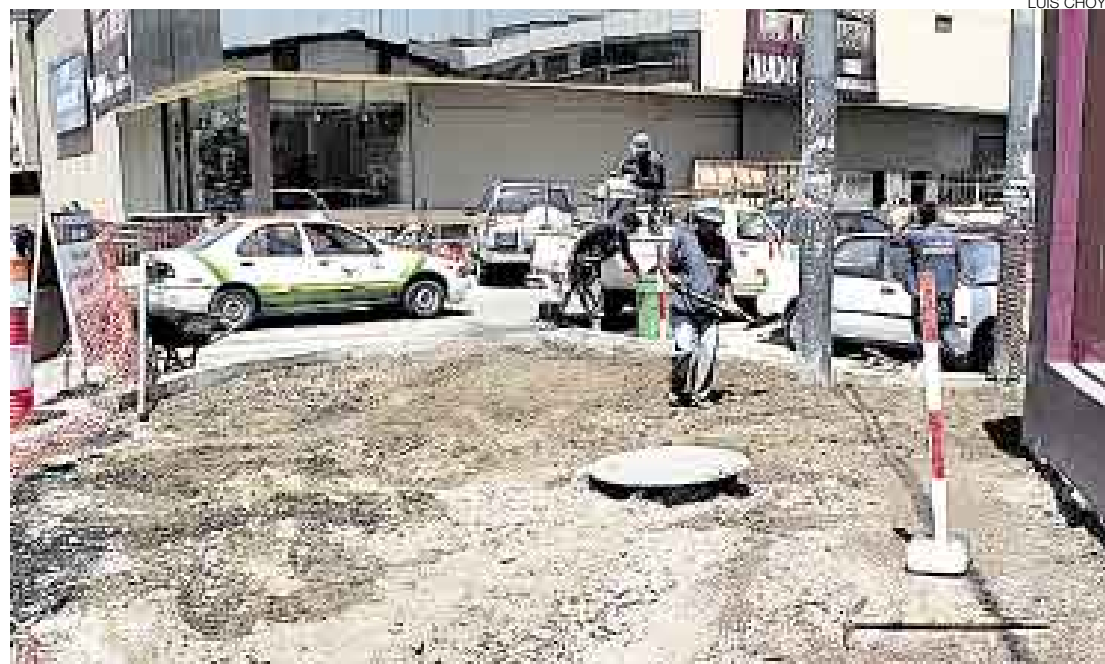
OBRA. Se reabrió el tránsito en la avenida Arequipa, pero falta señalar la pista y completar el resane de veredas.

■ Por ahora solo pasan vehículos particulares por las primeras once cuadras de la arteria