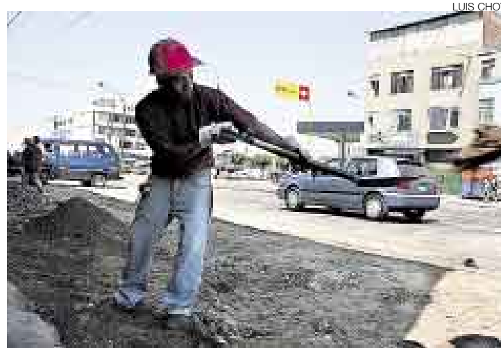
COMIENZO. La Municipalidad de La Victoria construirá primero las veredas de la avenida Parinacochas para luego renovar la carpeta de asfalto.