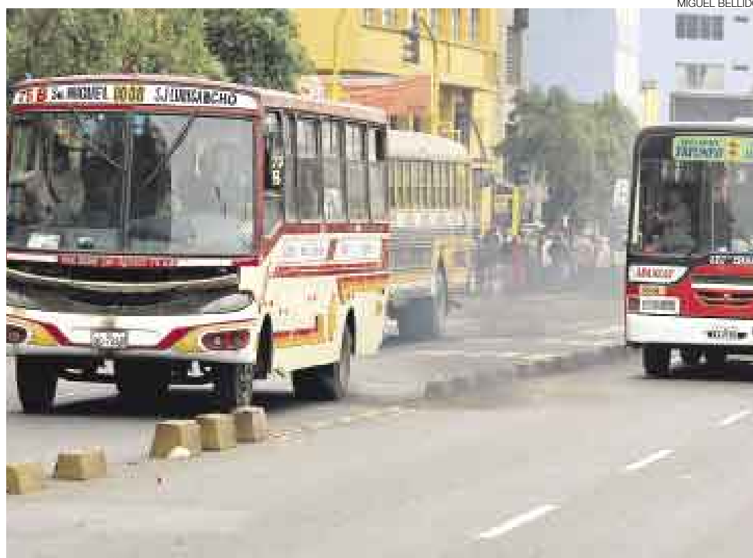
YA NO DAN MÁS. Este año 311 ómnibus de transporte público cumplen 35 años. Todas estas unidades, altamente contaminantes y peligrosas, serán retiradas de circulación. El próximo año se espera una cifra similar.

El 1 de julio del 2006, el concejo metropolitano estableció en la Ordenanza 954 que las unidades con una antigüedad igual o mayor a 35 años dejarían de circular de inmediato. La disposición –que no se cumplió con la prontitud que exigía la norma– empezó a aplicarse el año pasado cuando fueron retirados de circulación unos 150 vehículos que cumplirían 35 años de servicio, según la