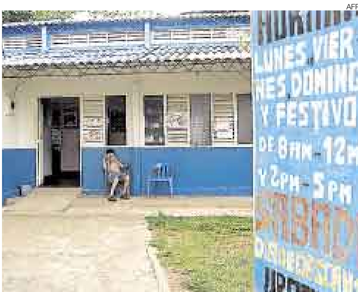
SALUD. En este centro médico del poblado El Capricho en San José del Guaviare habría sido atendida de sus dolencias Ingrid Betancourt.

Francia envió una misión médica a Colombia para tratar de llegar a Betancourt, una ciudadana franco-colombiana que desde febrero del 2002 permanece secuestrada en la selva en manos de las FARC, pero el grupo terro-