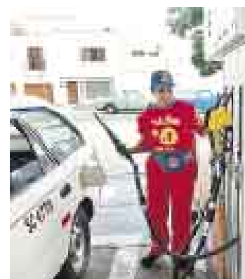
AUTOMÓVILES. Los autos gasolineros tienen gran demanda.