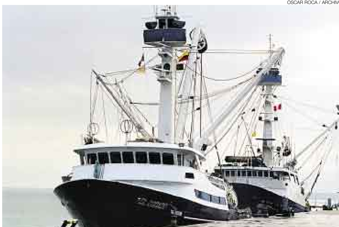
JUREL EN MARCHA. Las condiciones oceanográficas del mar peruano indicarían una mayor presencia de jurel y caballa, especies acostumbradas a aguas de mayor temperatura que la anchoveta.

Geomap refiere que, según el modelo de pronósticos que utiliza para proyectar las condiciones oceanográficas del mar peruano, la ola de calor que vivimos se prolongará hasta setiembre de este año, “si no es más”. Según su último reporte, del 27 de marzo, el calentamiento podría “llegar a ca-