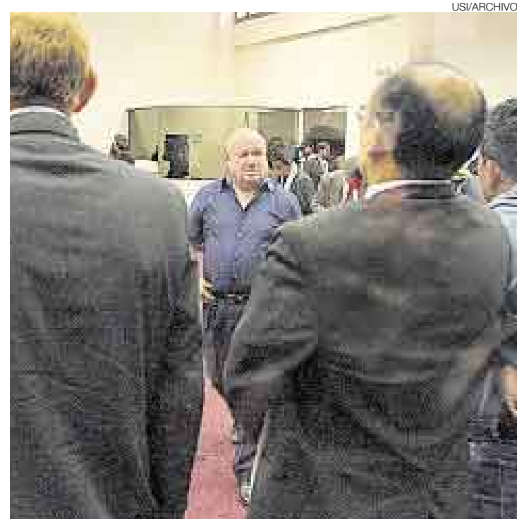
LESA HUMANIDAD. Lector subraya el significado histórico de la sentencia contra los responsables de la matanza de La Cantuta.