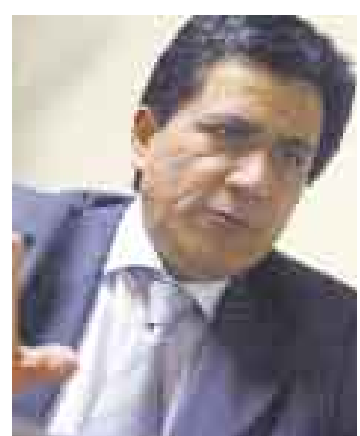
¿EL HILO? Ferradas se alejó del cargo mientras dure investigación.

■ Coordinador de la PCM en el Congreso impulsó intento de blindar a parlamentario aprista