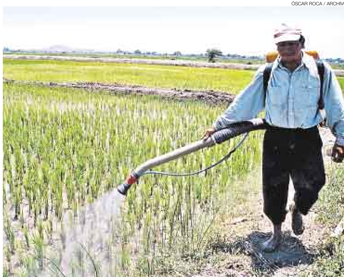
ÓSCAR ROCA / ARCHIVO

Las razones de esta escalada de los precios –según el BM y la FAO– podrían resumirse en el uso de granos en la elaboración de los biocombustibles, la mayor demanda de alimentos por parte