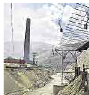
SIN AVAL. Certificadora alemana retiró certificado a fines de marzo.