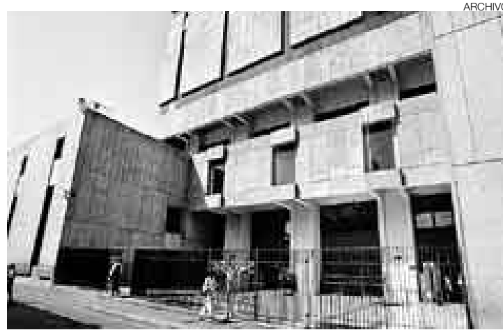
HACIA ARRIBA. Medidas del Banco Central de Reserva encarecen el crédito, al restringir la liquidez. Así, las tasas suben.