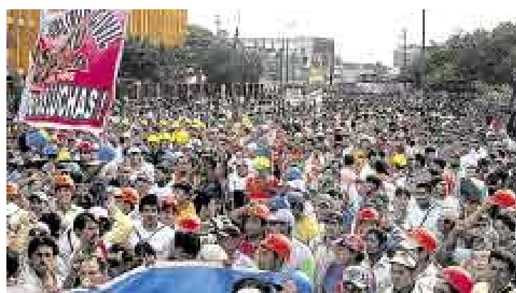
PEOR IMPOSIBLE. Por más de dos horas se congestionó el tránsito en las avenidas Arenales y Canadá.

La movilización ocasionó una gran congestión vehicular a lo largo de las 40 cuadras que re-