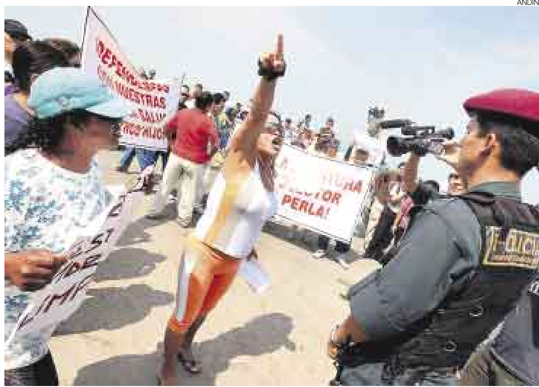
LUZ VERDE. La apertura del colector de La Perla es inminente, pese a que los vecinos de ese distrito chalaco, que pernoctan en la zona, han anunciado que se opondrán a los trabajos hasta las últimas consecuencias.

“Según informes técnicos, el uso del colector de La Perla no afectará a las ocho mil familias, como