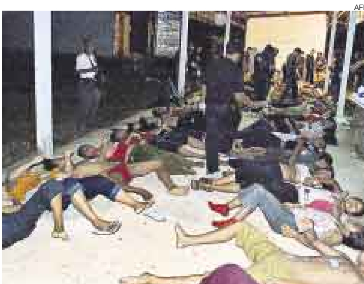
TRAGEDIA. Los 54 inmigrantes birmanos murieron sofocados en un contenedor donde solo podían sobrevivir tres personas durante 24 horas.

Las víctimas, 37 mujeres y 17 hombres, eran “todos trabajadores emigrantes ilegales de Birmania (cuyo nombre oficial es Myanmar)”, declaró a la AFP