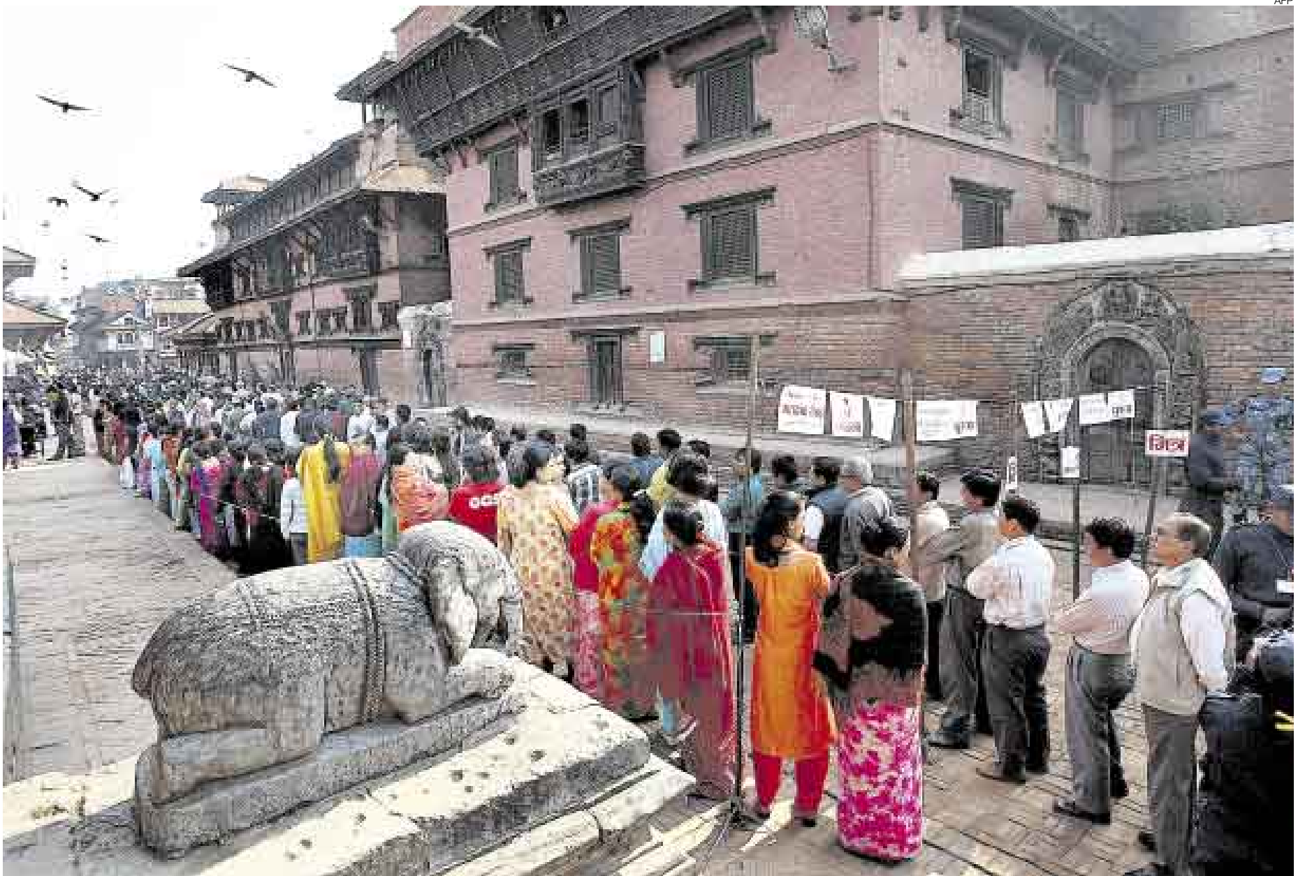
POR EL CAMBIO. La transición hacia la democracia ha costado a los nepaleses miles de muertos en una guerra interna. Ayer el país votó por la constituyente que iniciará el cambio del régimen.