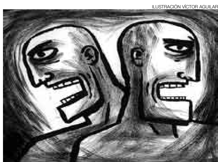
ILUSTRACIÓN VÍCTOR AGUILERA

En suma, los buenos propósitos no son suficientes; las normas que verdaderamente contribuyen a la solución de los problemas del país, son aquellas que advierten la diversidad de nuestra realidad y plantean soluciones de largo aliento y no aquellas que proponen soluciones al paso. ■