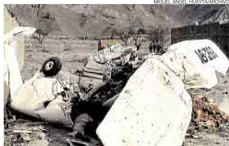
MUERTE EN NASCA. Lector clama por evitar muertes y asaltos contra los turistas que nos visitan (ver: Turismo agravado).